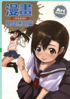
▲〈繁体字版〉 ・楓書坊文化出版社