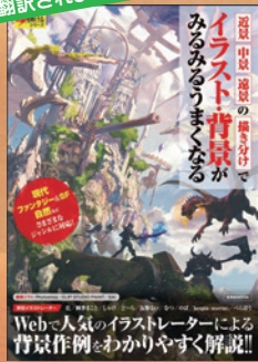
▲「近景/中景/遠景の描き分けでイラスト・背景がみるみるうまくなる」・玄光社