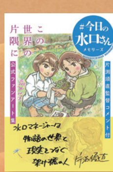
▲「この世界の片隅に【公式ファンアート集】#今日の水口さんメモリーズ」・ジェンコ/クロプルエ