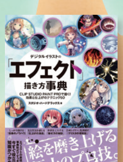
▲「デジタルイラストの「エフェクト」描き方事典」・SBクリエイティブ