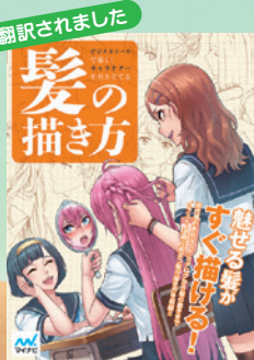
▲「デジタルツールで描く! キャラクターを引き立てる髪の毛の描き方」・マイナビ出版