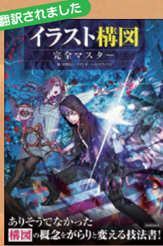
▲「イラスト構図 完全マスター」・玄光社