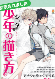
▲「少年(ショタ)の描き方」・廣済堂出版