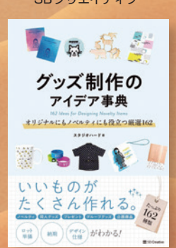
▲「グッズ制作のアイデア事典」・SBクリエイティブ