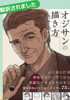
▲「オジサン」の描き方」・廣済堂出版