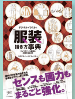
▲「デジタルイラストの「服装」描き方事典」・SBクリエイティブ