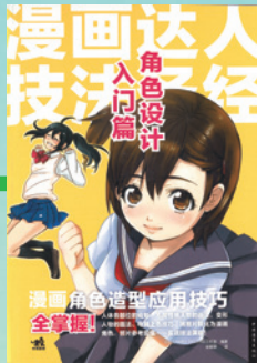
▲〈簡体字版〉 ・中国青年出版社