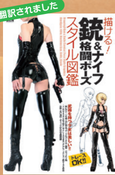
▲「描ける! 銃&ナイフ格闘ポーズスタイル図鑑」・MdN