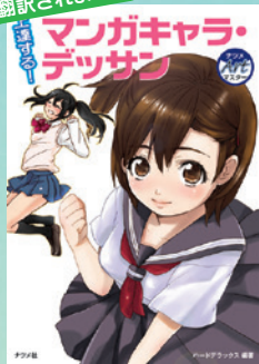
▲「上達する!マンガキャラ・デッサン」・ナツメ社