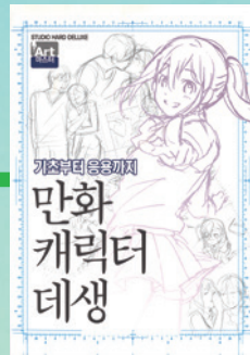
▲〈韓国語版〉 ・鶴山文化社