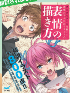
▲「デジタルツールで描く! 感情があふれ出るキャラの表情の描き方」・マイナビ出版